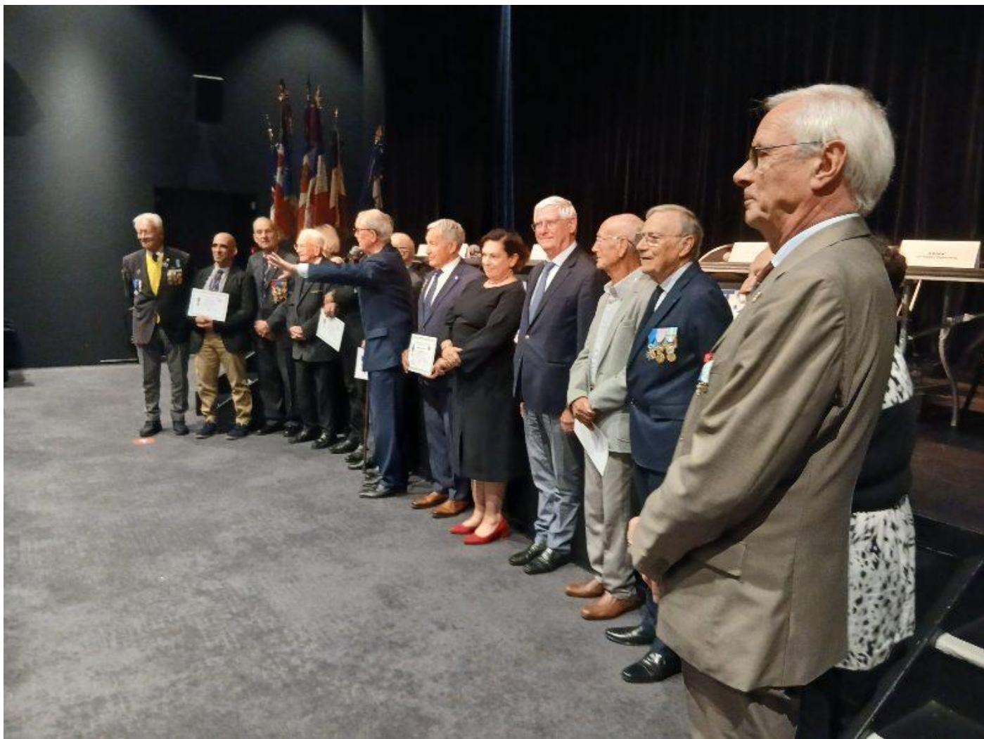
Moment de convivialité au « Voilier » avec les adhérents de Cannes lors de ce congrès départemental.