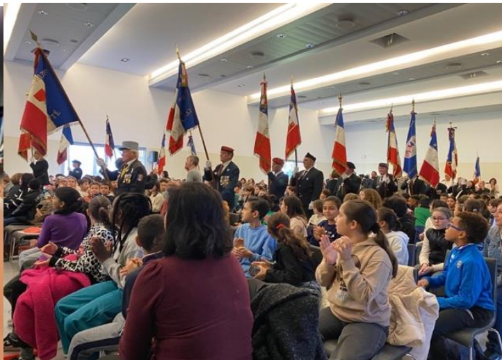
Mougins – Le Cannet